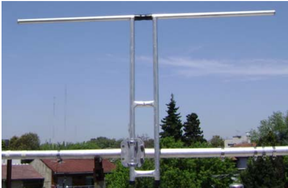
Dipolo en proceso de medición

Antena omnidireccional de polarización vertical.